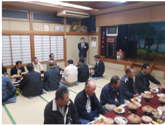
農場見学後、勉強会を行い、最後に意見交換会を実施しました。